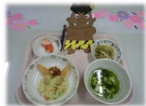
今日の給食は節分メニューです